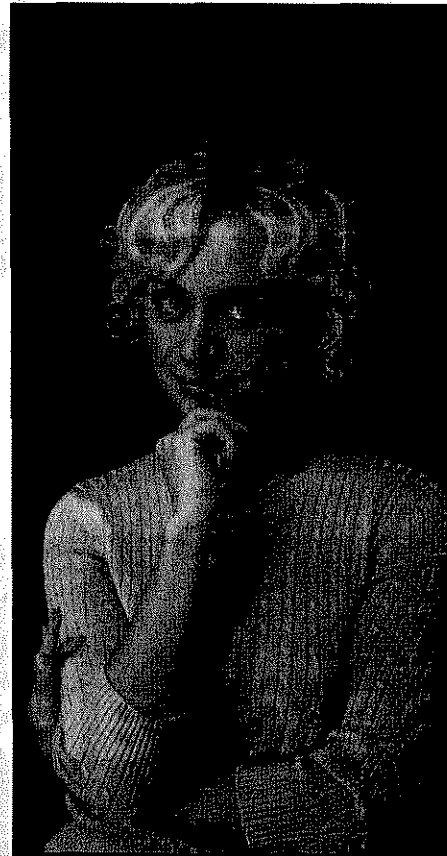
Die ausgeschriebenen Positionen richten sich an weibliche und männliche Bewerber.

Das Bundesfamilienministerium hat eine Mentoring-Börse eingerichtet, in der bislang schon über 500 Frauen inseriert haben. Zurzeit wird die Online-Börse allerdings überarbeitet, sie soll demnächst aber wieder zur Verfügung stehen. www.frauenmachenkarriere.de